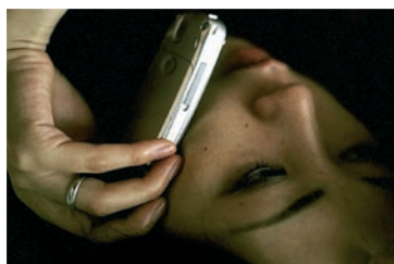
Phone call