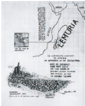
Robert Smithson, The Hypothetical Continent of Lemuria , 1969.

En faisant jouer leur imagination, les enfants manipuleront les codes cartographiques et développeront leurs capacités à créer et reconnaître des repères spatiaux. Ils expérimentent plusieurs représentations cartographiques et utiliseront plusieurs techniques artistiques, à l'instar de R. Smithson.